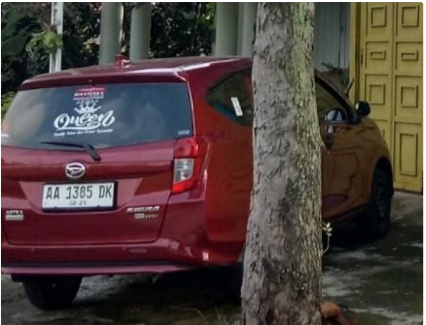
Foto: Mobil yang digelapkan

BOYOLALI - Sebuah laporan penggelapan mobil merek Daihatsu Sigra dengan nomor polisi AA 1385 DK mencuat di wilayah Boyolali, setelah korban melaporkan kejadian tersebut kepada pihak kepolisian. Kasus yang terjadi pada Kamis (2/1/2025) sekitar pukul 13.00 WIB di Dukuh Tegalsari RT 02/RW 02, Tambak, Mojosongo, Boyolali , ini melibatkan kerugian hingga Rp160 juta.